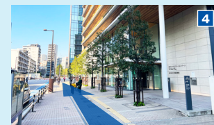
大崎図書館を通過。