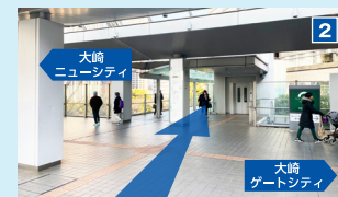
デッキを直進。「大崎ゲートシティ」「大崎ニューシティ」を通過した先のエスカレーターで地上へ降り、直進。