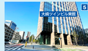
「ベルサール大崎東」(住友不動産大崎ツインビル東館)に到着します。