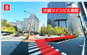
バス停の次の信号の右手が「住友不動産大崎ツインビル東館」「ベルサール大崎東」の入口は、ビル右側奥です。