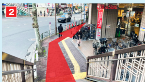
東急池上線ルートに合流。歩道橋を下り、そのまま道なりに進みます。