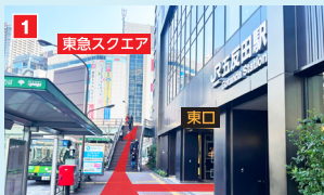
JR五反田駅 東口を背にして右手の歩道橋を上がり、東急スクエア側へ。