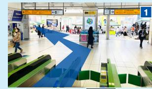
南改札口を出て左側、新東口方面へ。