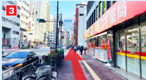
スギ薬局前、ローソンを通過。そのまま直進。