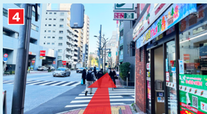
セブン-イレブン、「東五反田三丁目」バス停を通過。