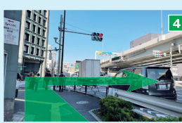
新隆慶橋西詰(交差点)で川を超えるように横断歩道を2つ渡ります。