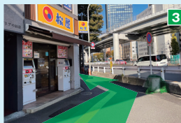
松屋を左手に通過し、道なりに200mほど進みます。