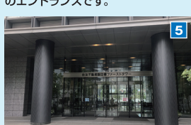
「住友不動産飯田橋ファーストタワー」内に「ベルサール飯田橋ファースト」があります。