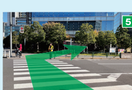
横断歩道を渡った正面の「住友不動産飯田橋ファーストタワー」内に「ベルサール飯田橋ファースト」があります。