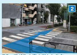
50mほど先の突き当たりを右へ。