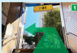
B1出口を出たら左へ進みます。