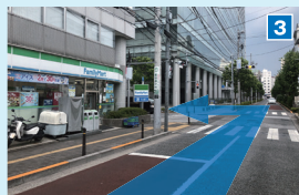
左手角にファミリーマートのある交差点を左折。