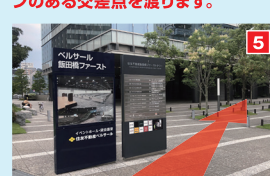
横断歩道を渡った正面の「住友不動産飯田橋ファーストタワー」内に「ベルサール飯田橋ファースト」があります。