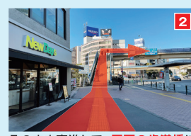
そのまま直進して、正面の歩道橋に上がり、右方向へ。