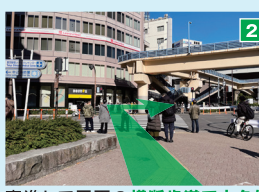
直進して正面の横断歩道で大久保通りを渡り、歩道橋に沿って進みます。