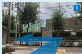
C3出口を出たら左へ進みます。