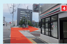
左手に首都高速と川を見ながら170mほど直進。角にセブンイレブンのある交差点を渡ります。