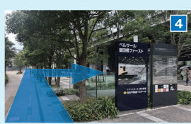
そのまま100mほど進んだ右手が、「住友不動産飯田橋ファーストタワー」のエンタランスです。