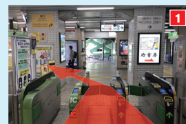
東口の改札を出たら左へ進みます。